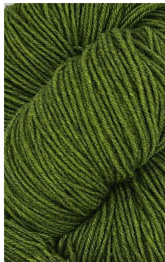
710 Oliva Olive