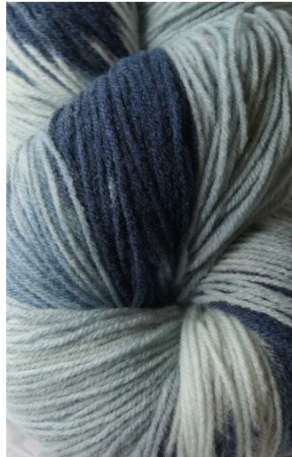
210 Multicolor Azul Multicolor Blue