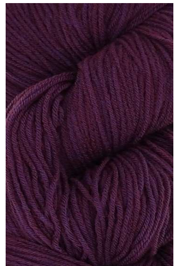
810 Púrpura Purple