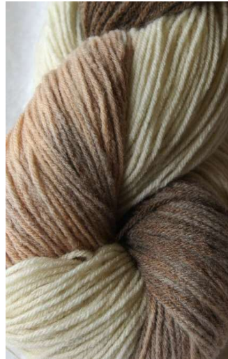
310 Multicolor Beige Multicolor Beige