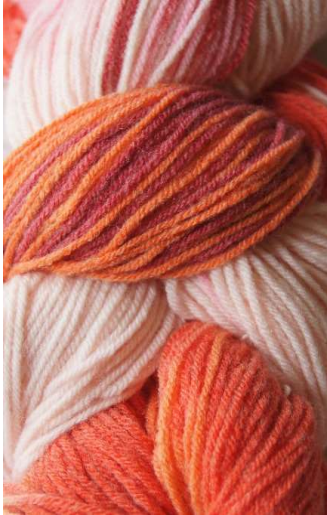
110 Multicolor Rosa Multicolor Pink