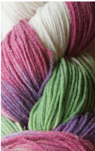
510 Multicolor Verde-Fucsia Multicolor Green-Fuchsia