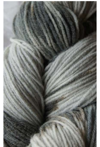
410 Multicolor Gris Multicolor Gray