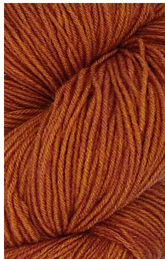
610 Naranja Quemada Burnt Orange