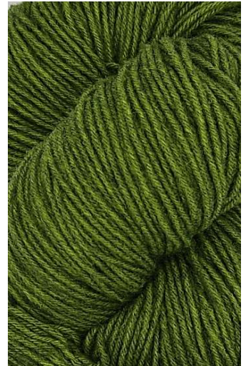
710 Oliva Olive