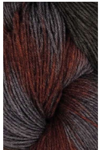
820 Gris Oxido Oxide Gray