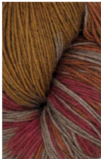
620 Ocre Rojizo Reddish Ocher