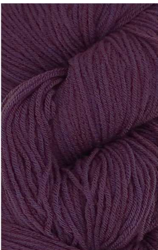
810 Púrpura Purple