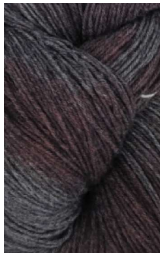
720 Azul Rosado Blue Pink