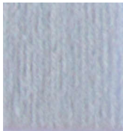
5045 Gris Gray