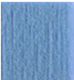
5056 Azul Empolvado Foggy Blue