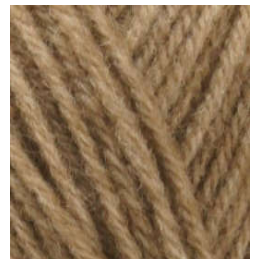
5076 Topo Taupe