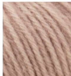
5062 Lila Empolvado Foggy Lilac