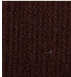
5046 Marrón Brown