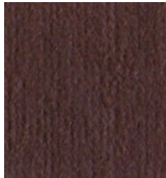
5061 Berenjena Aubergine