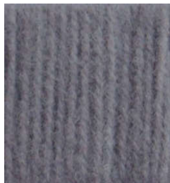
5057 Gris Medio Medium Gray