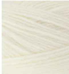
5020 Crudo Ecreu