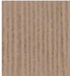
5054 Piedra Stone