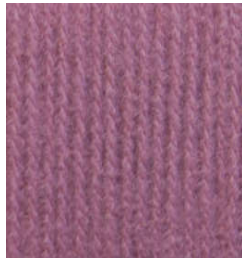
5049 Rosa Palo Pale Pink