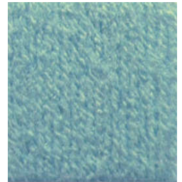
5058 Verde Empolvado Foggy Green