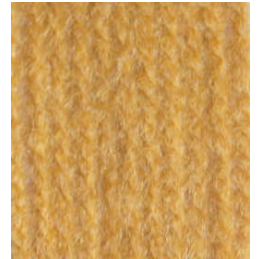
5074 Mostaza Mustard