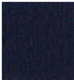
5018 Azul Marino Blue Navy