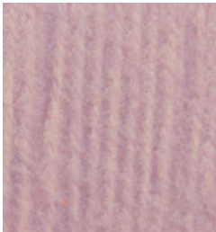
5055 Rosa Empolvado Foggy Pink