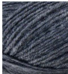
5064 Gris Oscuro Dark Gray