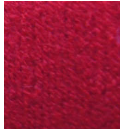
5010 Rojo Red