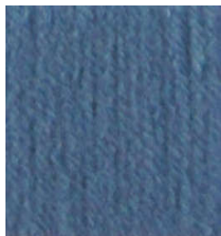
5051 Azul Azafata Royal Blue