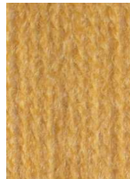
7074 Mostaza Mustard