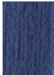
7075 Azafata Royal Blue