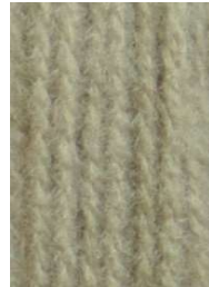
7011 Piedra Stone