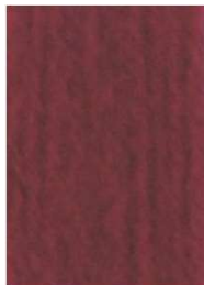
7006 Cereza Cherry