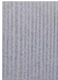
7045 Gris Perla Pearl Gray