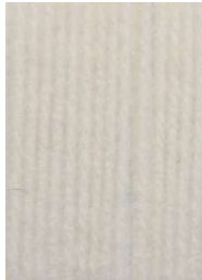
7020 Hueso Bone