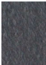
7015 Gris Marengo Charcoal Gray