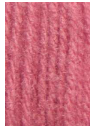
7039 Rosa Palo Pale Pink