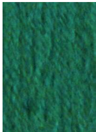
7059 Verde Musgo Moss Green