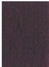
7062 Granate Oscuro Dark Maroon