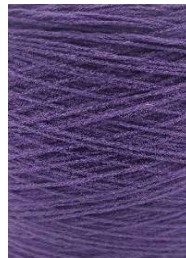
7077 Morado Purple