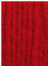
7010 Rojo Red