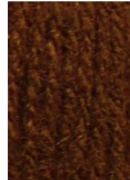
7022 Marrón Brown