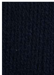
7019 Negro Black