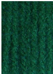
7024 Verde Botella Dark Green