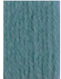
7058 Verde Helecho Fern Green