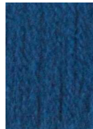
7063 Azul Petroleo Petrol Blue