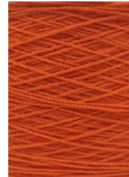
7076 Naranja Orange