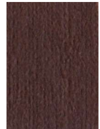
7061 Berenjena Aubergine