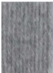
7013 Gris Gray