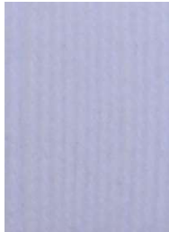
7001 Blanco White