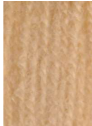
7033 Beige Beige