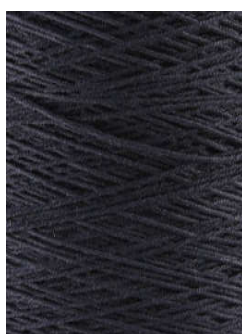
3018 Azul Marino/Blue Navy