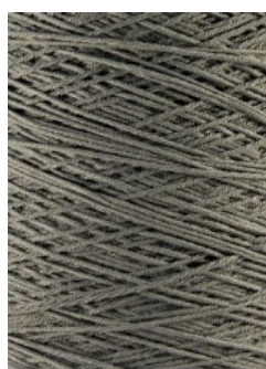
3055 Verde Salvia/Sage Green