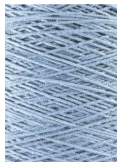
3051 Azul claro/Light Blue