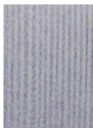
7045 Gris perla