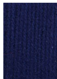
7018 Azul Marino