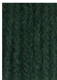
7024 Verde Botella