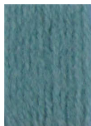
7058 Verde Helecho