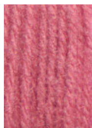
7039 Rosa Palo