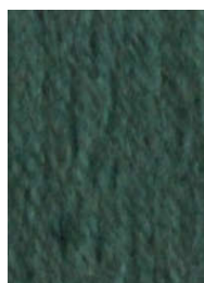
7059 Verde Musgo