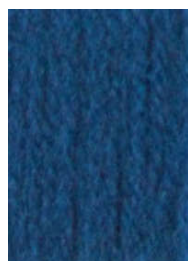
7063 Azul Petroleo